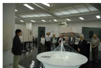
7/7 前披露（説明会）の様子