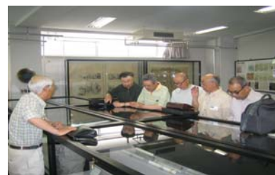
サイエンスボランティア学習会の様子