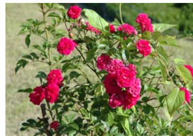
鉱業博物館の脇に咲くバラ

前期企画展の前披露も無事行われ、企画展も8月20日まで開催しております。皆さんの科学への扉が、ますますひらかれますように・・・