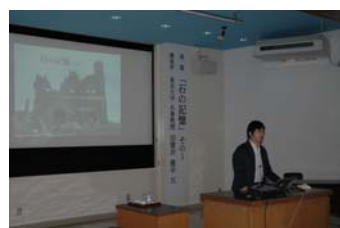
7/8 講演会「石の記憶」その1の様子