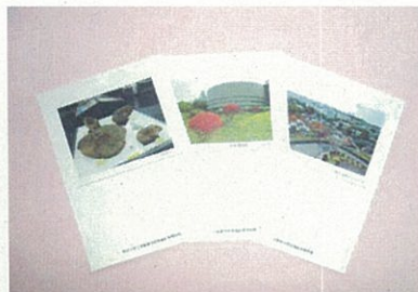
オリジナル絵はがき 8枚組 250円 絵柄は展示物や館内外の風景を撮ったものです。