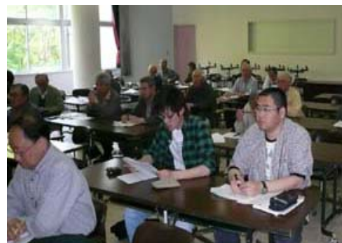
↑ 学生のサイエンスボランティアもいます!