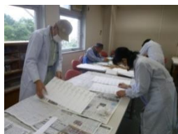
約4,000点の標本ラベルを1つ1つ手作り

サイエンスボランティアの皆さんや学生の皆さんはリニューアル工事の当初から様々なお手伝いをしてくださいました。細かい手作業が多い中、根気強く丁寧に仕上げてくださいました。オープン前日には館内の清掃をしたり展示ケースを磨いたり最後までお手伝いいただき、無事お披露目することができました。