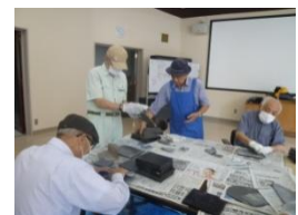
標本展示台の補修や彩色作業