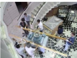
粉砕機に木柱を渡して皆で担ぎます