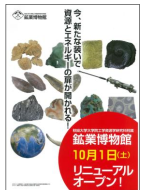
リニューアルオープンのパンフレット

リニューアルオープン記念として1日午後と2日は一般に無料開放し、約800名もの来館者が訪れ大変な賑わいとなりました。