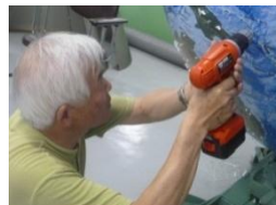
地球儀にLEDライトを設置するための配線作業