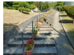
プランターの花の植付けや設置作業