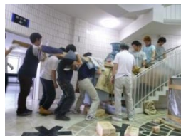
力を合わせて階段を一段ずつ上げていきます