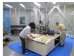
約4ヶ月かけて行われた石油槽模型の修復